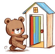
door de deur

eer, oor, eur, de beer loopt door de deur